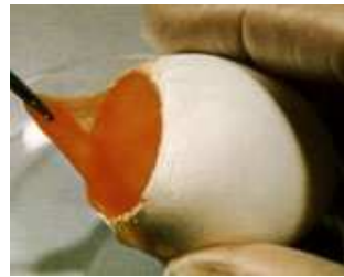
Goodpasteure és Burnet